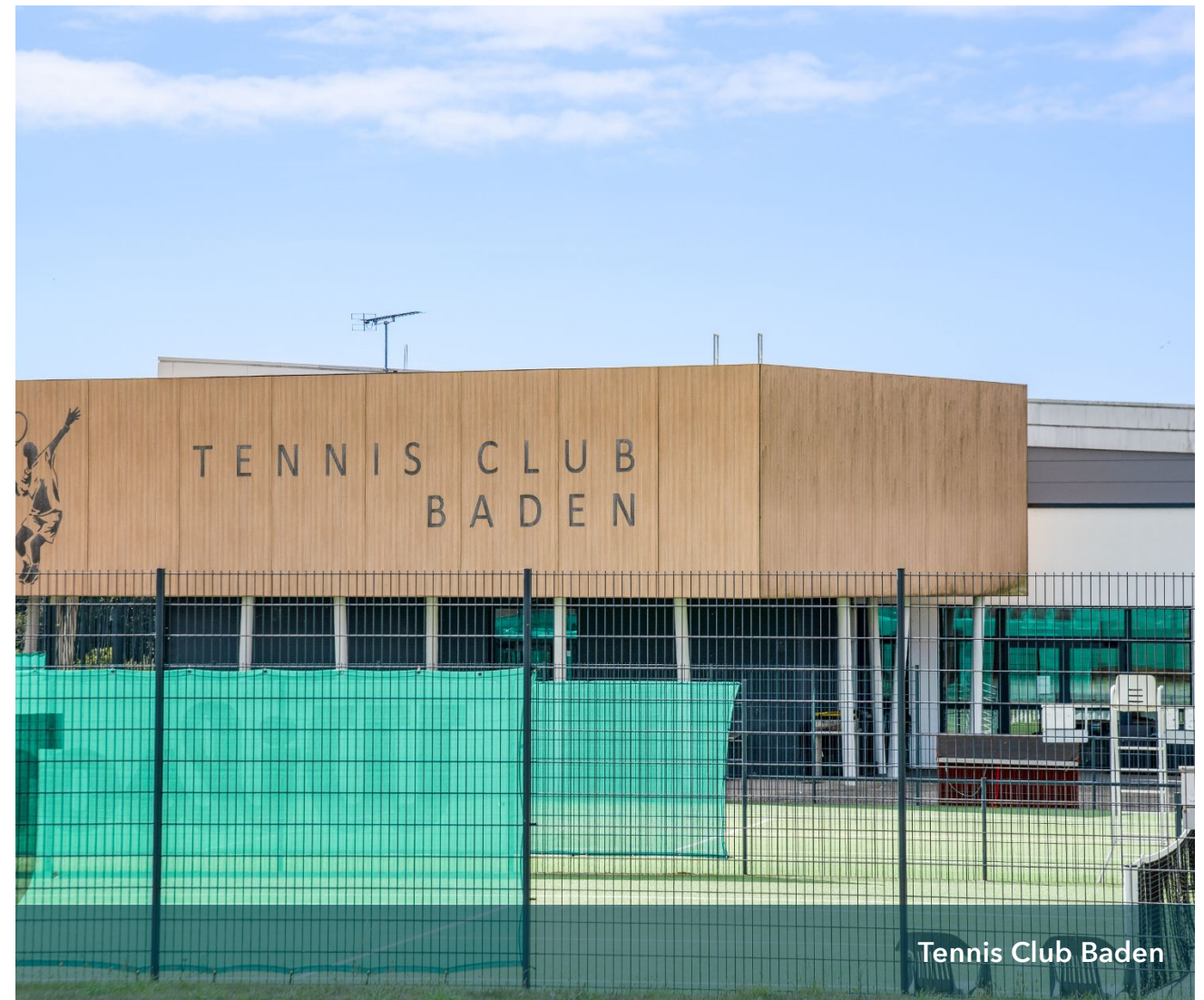
Tennis Club Baden