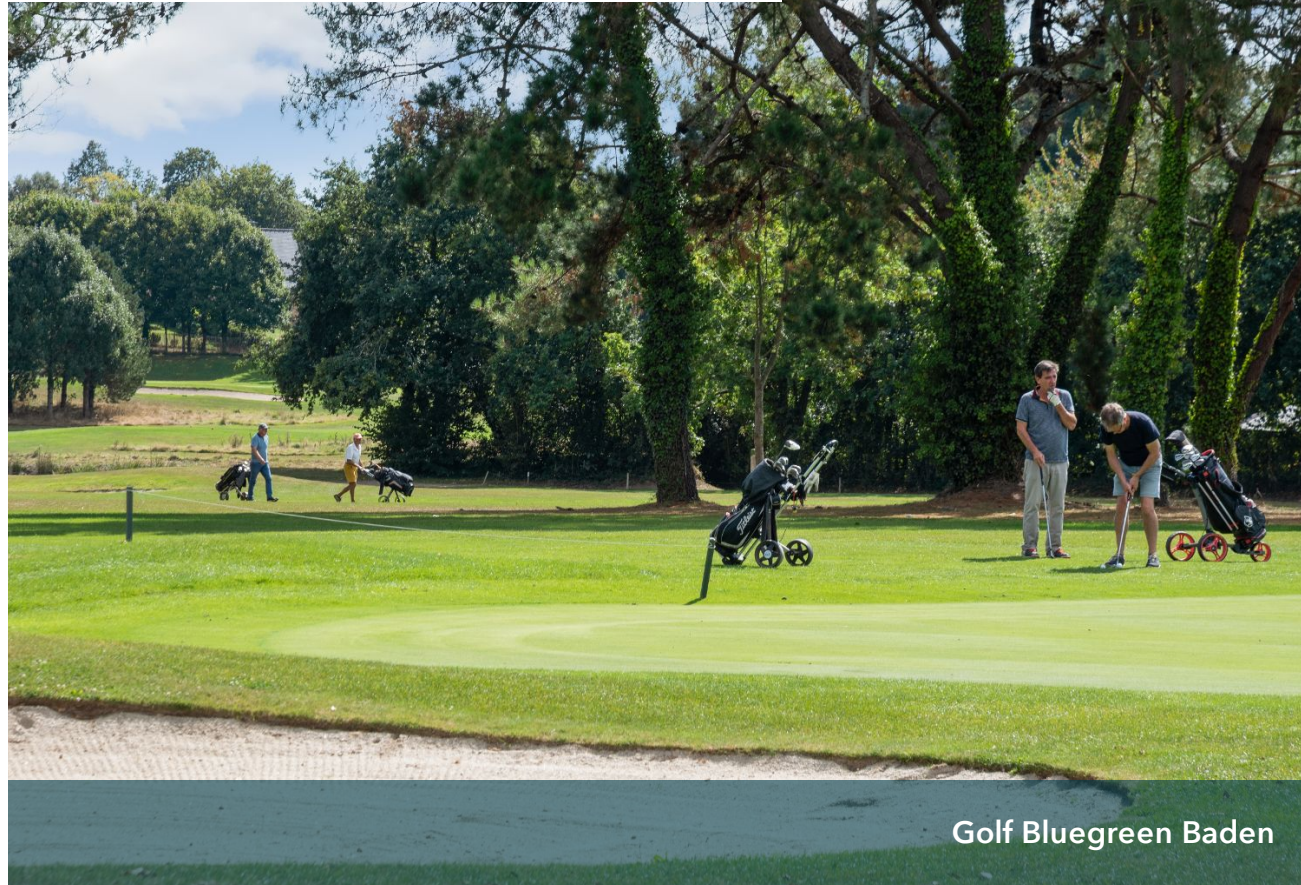
Golf Bluegreen Baden