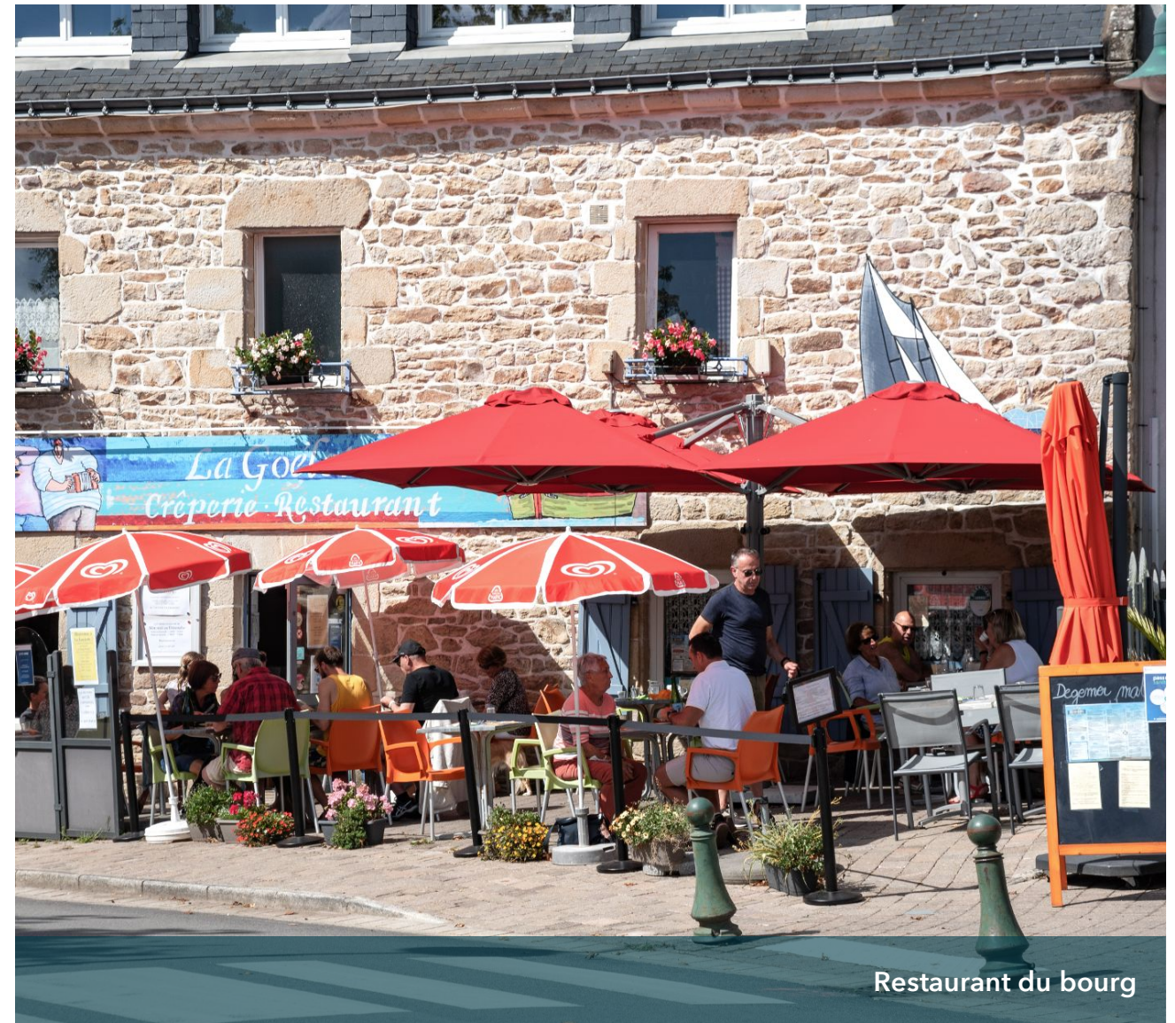
Restaurant du bourg

Des marchés nocturnes s'organisent l'été de mi-juillet à mi-août, les jeudis soirs, où une trentaine d'artisans