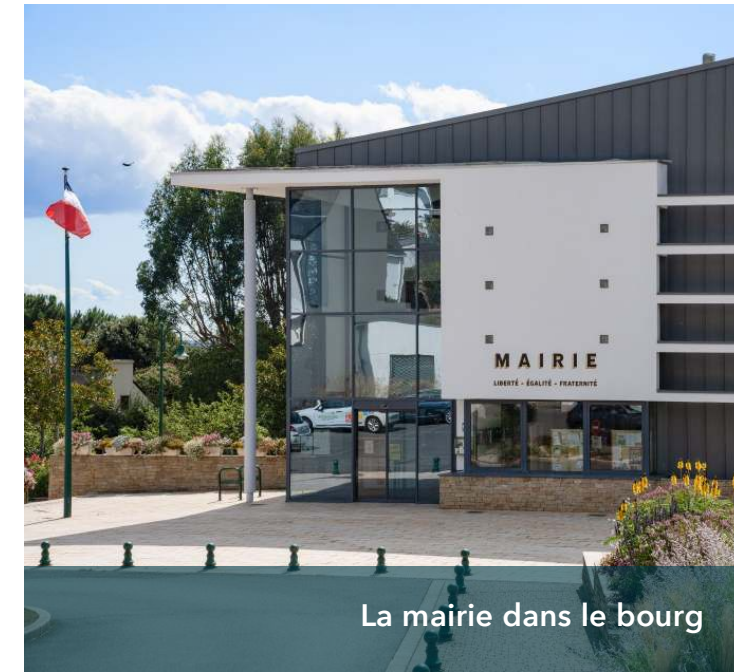
La mairie dans le bourg